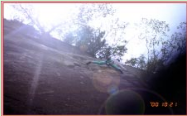
究極のムービングだ

X-Adventureの疲れがとれかかるころ、身体が山へ行きたいといっている。早速近くのクライミングポイントに足を運ばせる。ここは高さが10mも無いがほとんどがスラブやフェイスやクラックでなかなか手強いので良いトレーニングになる。