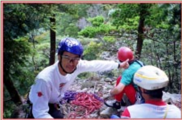
1ピッチ 40mの大テラスで小休止