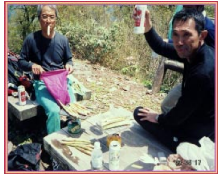
スズコ焼きで乾杯