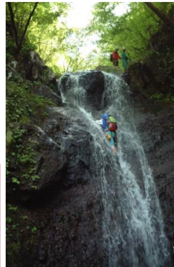
10m フォールを直登の私

扇ノ山上地川本谷・・・このシーズンの昨年はその合流地点の左谷の唐戸谷に遡行した。 今回はビッグフォールこそないが5m から 10m 程の滝がいくつも点在する本谷に遡行することにした。当然に今の時期は遡行中に山菜を探り山頂ではチシマ笹の新芽のスズコを採って焼きタケノコにありつくのが唯一の楽しみでもある。 内容的には680m から遡行し始めて山頂1309mまで、距離は約3.5km。1000m 付近からはまだまだ巨大な雪渓が残っていて驚いてしまった。山菜はギボウシ、ミズ、ウド、フキ。キノコはエノキダケと巨大シイタケと思いきや大収穫となった。