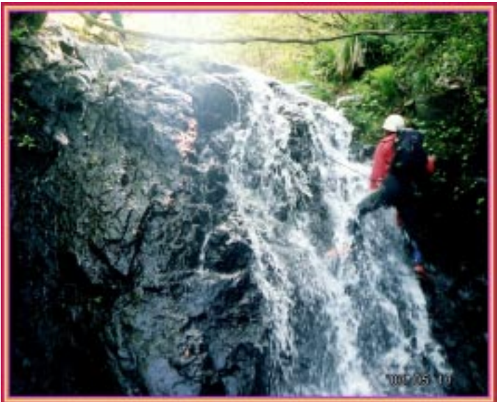
滝をトラバースの横さん