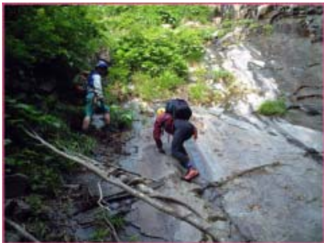
布滝左俣のスラブ