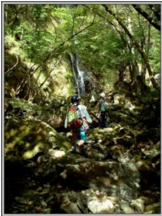
深山幽谷の世界へ

ハーケンからぶら下がっている針金を持ったとたんにプチ切れてロープをしていなかったらヤバイところであった。