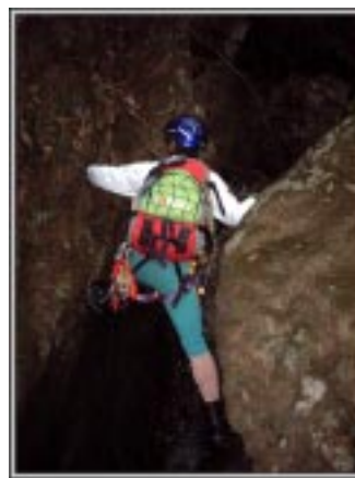
両股開きでこらえる