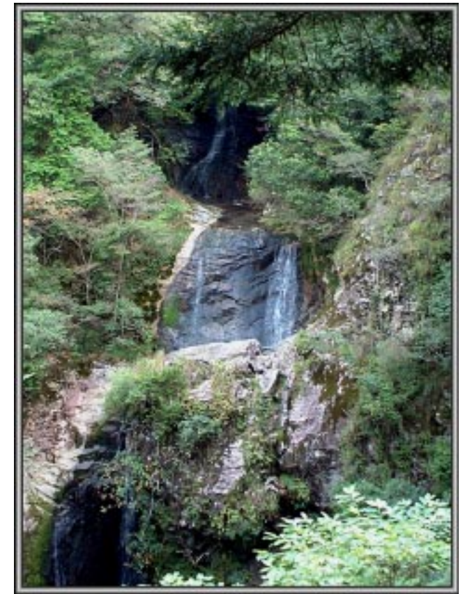
三ノ滝3段30mの見事なビッグフォール