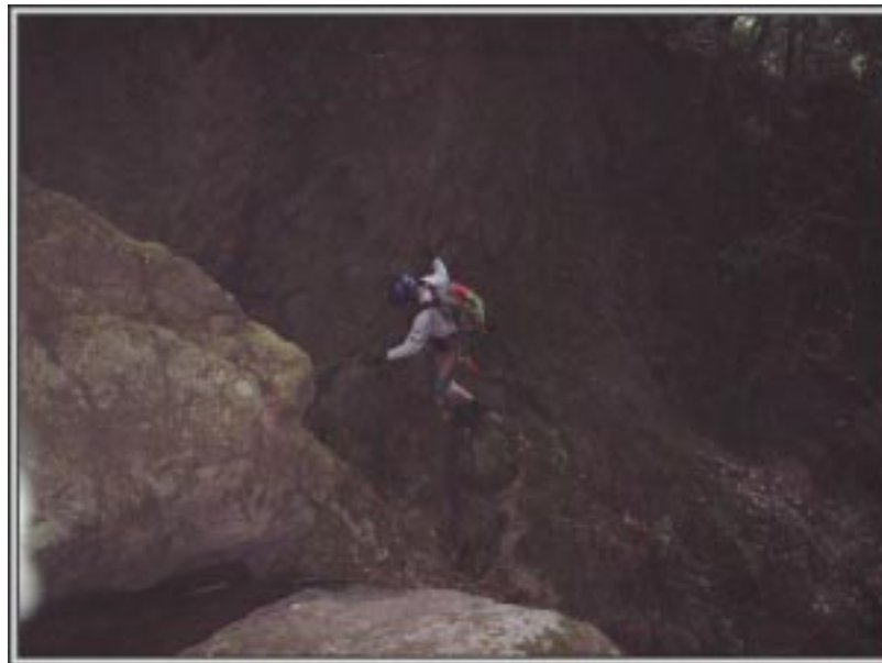
いきなりのヘツリ

3段30mの三ノ滝は素晴らしく、流れ落ちる水流が生きているかのように途中で弾け飛んで水滴となり優美な姿をかもし出している。これは右手前のルンゼから高巻き滝頭に降りた。続いて素晴らしい10mのナメ滝が現れるが真ん中