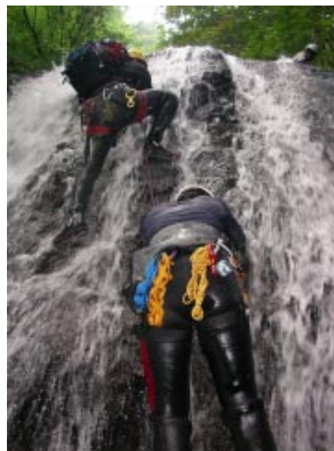
コンティニアスで登る

ングなのでとても登れる代物ではない。石野氏は昨年は滝の右のルンゼを登って巻いたと言っていたが、今回はより安全をとってまだその右の草付きを登って巻いて滝の上部へ懸垂下降で降り立つ。そこからはまだ10×4の連爆であるが、これは楽しんで登らせてもらった。