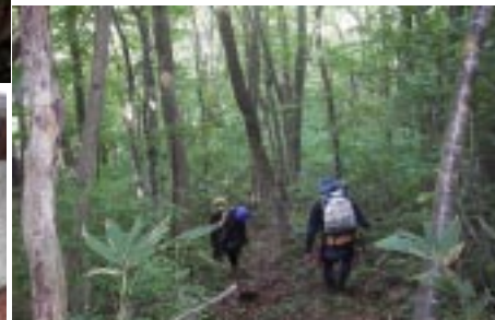
ブナの実コロコロ