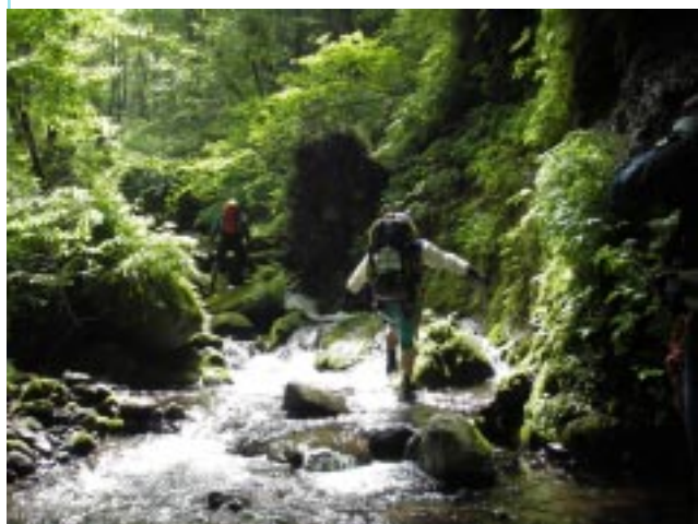
大自然との調和が始まる

山小屋にたどり着くと装備を降ろし、今晚のメインであるスズコを狩りに背丈ほどのチシマ笹の