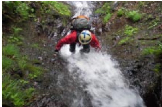
シャワーを浴びて

東西南北ともガラス張りの美しい小屋なので明るくなるもの早く早々に目覚める。ゆっくりと朝食をとっても7時半には下山準備完了だ。下山ルートは大ズッコ手前から上地へ降りるルートである。ブナの灌木帯の稜線上の急な登山道はまさに「ブナの実コロコロ」と名付けてもいいくらいの急坂が続いている。4年前にこの坂をスキーで滑降したのを思い出す。