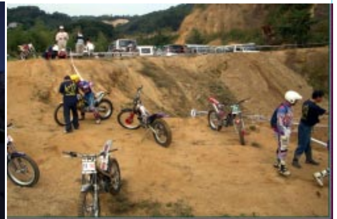
トライアルバイクキャンプ