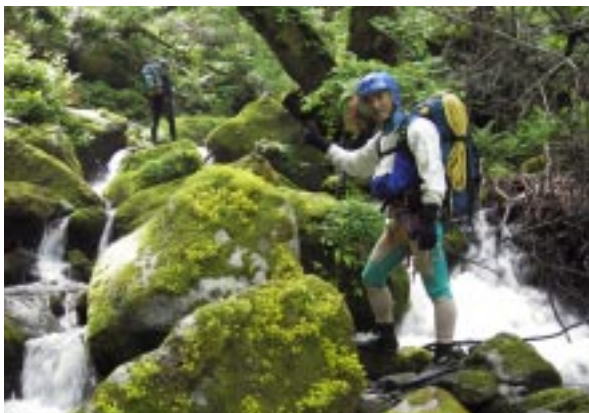
入渓地点・・・苔に咲く花

たっては飛び散る水滴をキラキラと輝かせている。まるで森全体が朝日に照らし出されて目覚めているかのようである。我々もフィトンチッドとマイナスイオンがたっぷりと染み込み心も体も洗礼されていく。