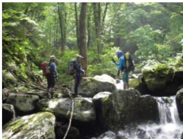
ホウやミズナラが生い茂る