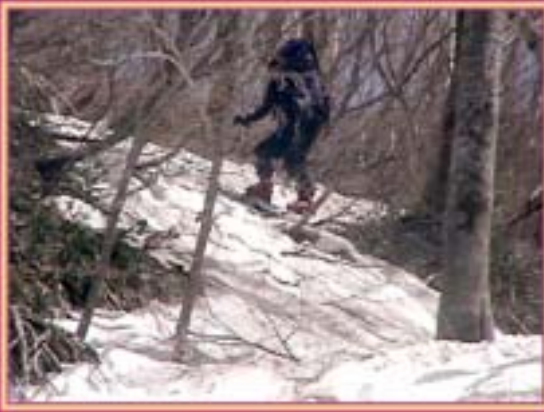
ブッシュ内を滑降の横さん