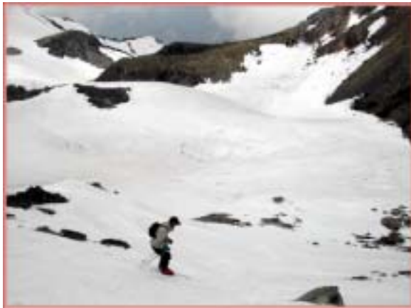
北面を滑降する横さん