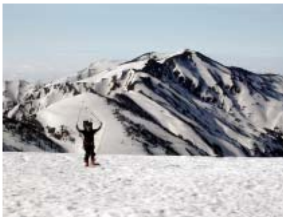
別山を後に横さん

ろうか、と心配だったが小さいテントと違いデカイ小屋が3棟も建っているからと思い、先に帰って朝食をとっていた。20分ほどたったらやっと小屋に戻ってきた「ガスってとまどってしまった、少し立ち止