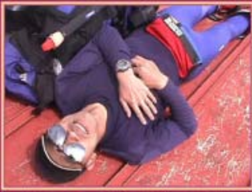
甚の助の屋根でくつろぐ横さん