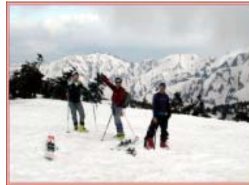
2244 m ピークにて

ここのピークは夏はブッシュで登れないのだがそれらが全て雪の下であるので広々としている。ここから見える白水湖はものすごく大きく見える。また南東の山々のカールも素晴らしく落ち込んでいる。しかし今いる所は10mくらいの切れ立った雪尻上で長いは無用である。ここから地獄谷方面に滑