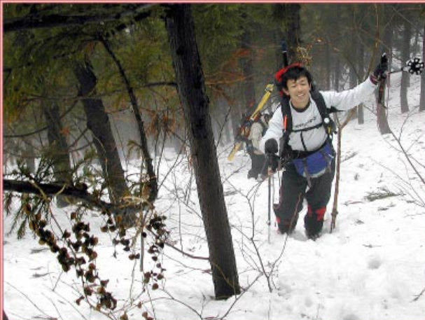
急登の杉林を抜けて

大本も引っ張りだが横さんは担ぎでの行動だ。スタートから霧雨混じりで合羽を着込むが、気温が高くて暑くてたまらなく途中で脱いでしま