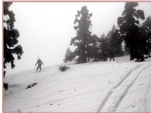
モナカに苦勞する

になってきた。このバーンでもパワースキーでバンバン飛びまくりである。さあ、しかしここからの狭い稜線は板をいかにコントロールするかによって技術の差が出てくる、と言っても私もへ口へ口でなんとかかんと東尾根避難小屋へ到着。彼らを待っていたが一向に来る様子もないのでそのま