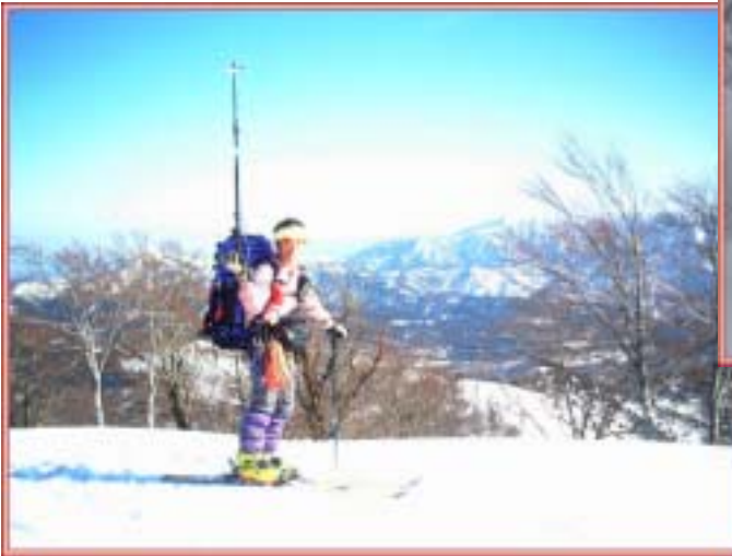
スコップ、赤布 etc いつもフル装備の私