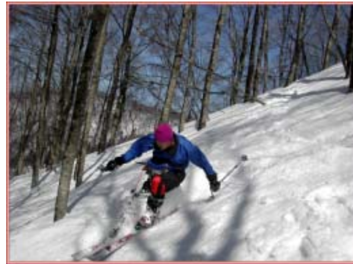
快適に飛ばす大本

先を滑って行った石野氏に笛で「止まれ」の合図を出す。地図で確認すればたかだか400mほどので沢に突き当たっているが下