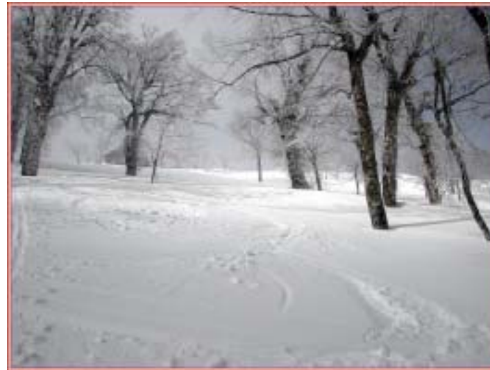
朝一のパウダーランを楽しむ