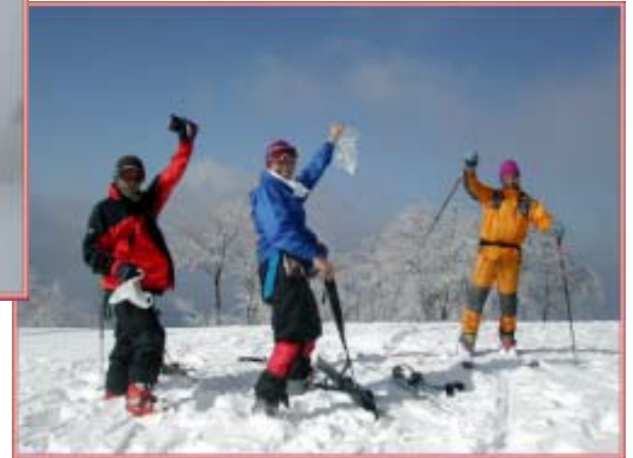
昨日の雨がウソのようだ！