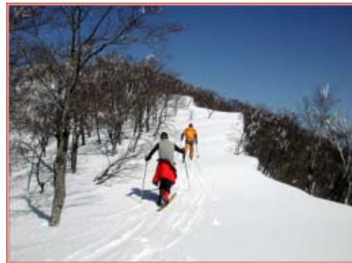
巨大雪尻の上をシール登行