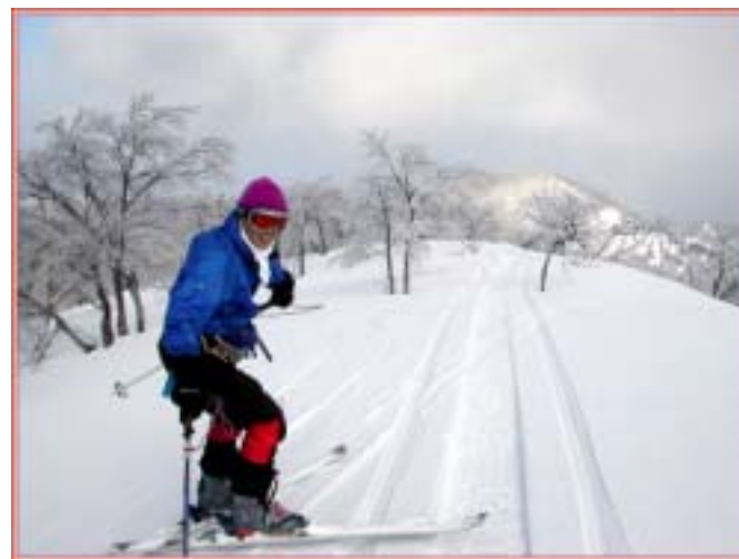
前に見えるの大ゾッコに行ってくるぜい！

ザックをデポしてみんなは軽装であるが、私は万が一の為にサブザックにツェルト・ザイル・エマージェンシー・予備着とピッケル・ハーネス装備である。