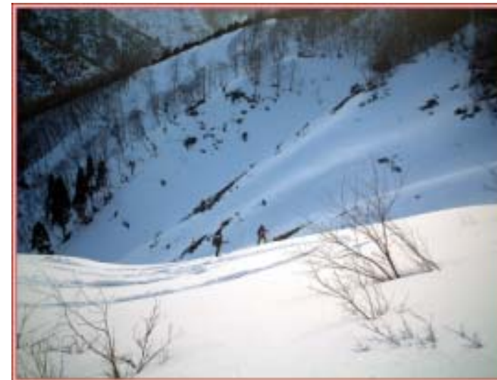
北アにも負けない壮大なカール

逆の北斜面はいいかも？・・・と突っ込むがここもやはり一緒であった。やむなく狭い小尾根を直滑&横滑りで乗り切り、最後の斜面へは