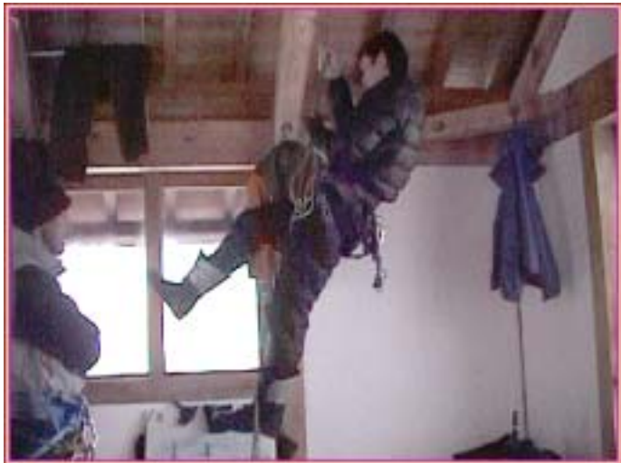
プルーゾックで攀じ上がる