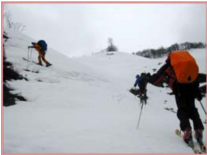
快適な？急斜面ををシール登行