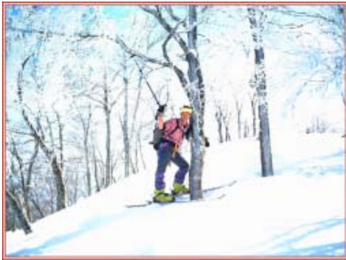
ブナに抱擁してパワーをもらおう

スも山頂付近だけであらうと踏んでシビレを切らせて早速に薄モヤにエビの尻尾が揺らぐブナ林の間をかいぐって最高のパウダーランを1本楽しむ。この斜面は私の最もお気に入りでもある。沢底まで滑り込んでシールで登り返しているもの