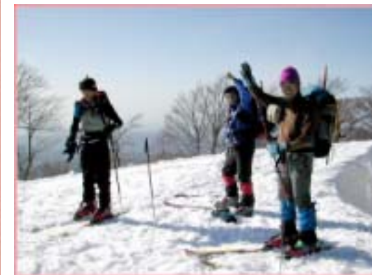
● また来るぞ〜い ●