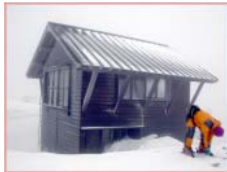
四方が窓の快適小屋