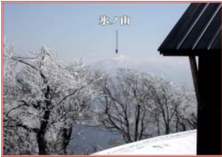
山頂から氷ノ山が見える