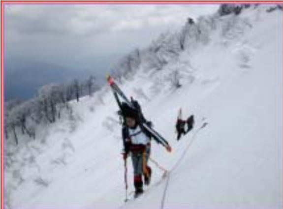
フィックスロープ張り訓練