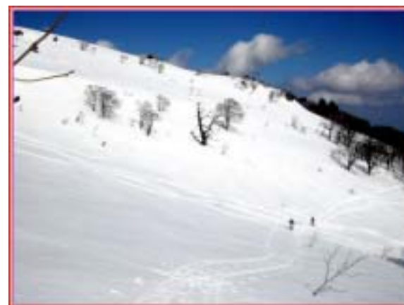
白いキャンパスに縦横無尽に描く