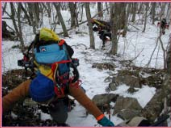
四つん這いになりながらの急登