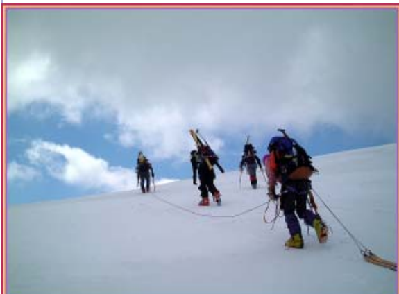
コンティニアスで行く