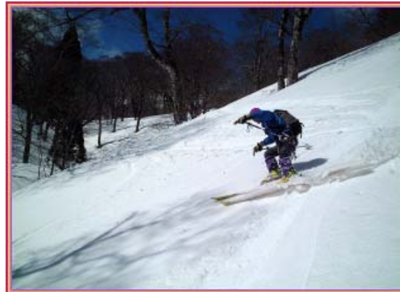
ブナ林へカッ飛ば私