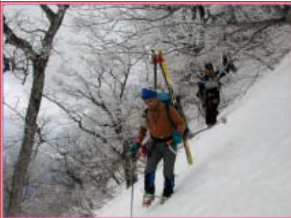
流れ尾根斜面の霧氷林