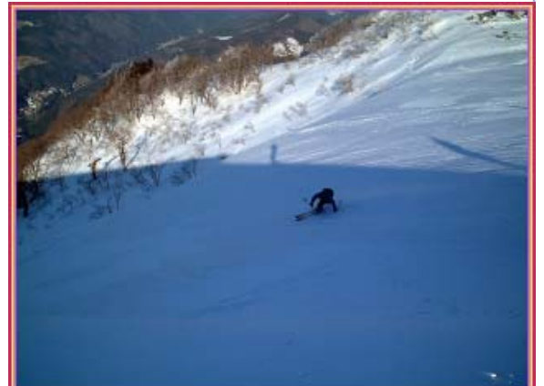
北斜面へカッ飛ぶ