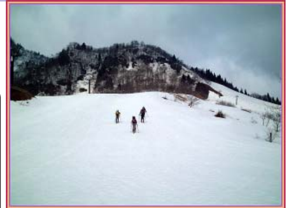
ゲレンデをシール登行

ザイル確保でピクストックのWアックスで雪壁に挑むのだが、いかんせん雪が昨夜の雨のために緩んでいてまな