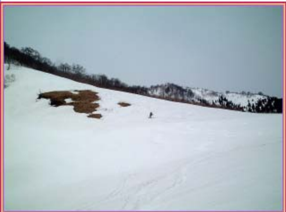
馬の背からホードー杉へ・・・