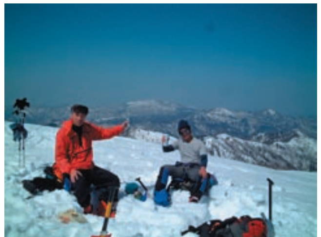
一滑りしてビールで乾杯！（後方は扇ノ山）