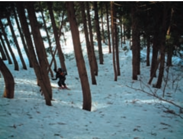
藪&スギの中をひたすらトラバースするとスキー場へ辿り着く

今回初めての若狭側からのアプローチであるが、しんどのいは最初 20 分だけで後は稜線伝いで非常に楽であった。これならだれでも来るであろうと感じられるほどだ。目標のわさび谷滑降は比較的緩やかな斜面であった。我々には少し物足りない感があった。谷の狭い所では左右の雪崩には注意したい。そして最後は藪スキー。「これぞ播州の山スキー」と思わせる 1 本である。2 日連続の山行で疲れたがこの天気の良いさは今シーズン最高であった。