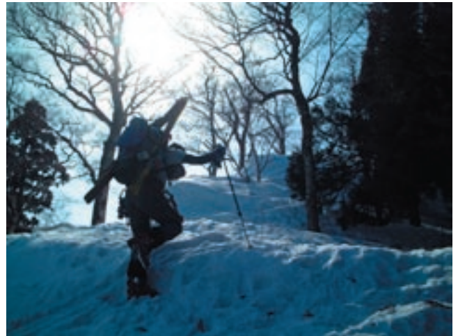
リフト最終からの急登 20分