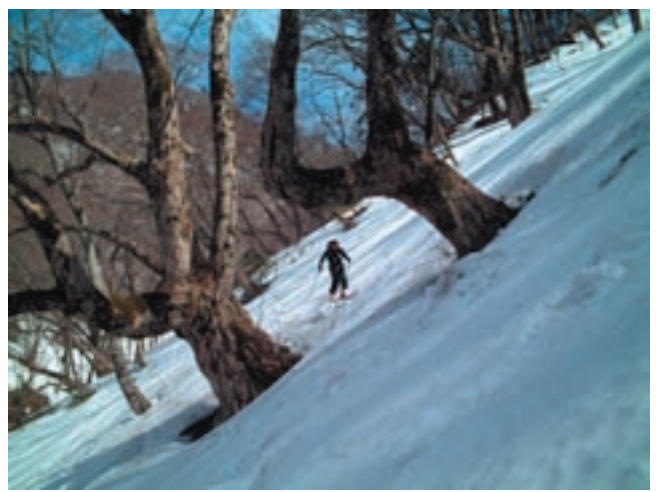
水が出てくると沢合流地点まで谷をトラバース

14:10 1000m わさび谷滑降 1000m 付近までずっと下りで足はパンパンになってしまった。この辺りから徐々に沢が出てくるので谷沿いにトラバースしながら進む。石野氏はこのトラバース中に3、4回転の物凄い大コケ。あと5mで沢に落ちるところであった(^;:。