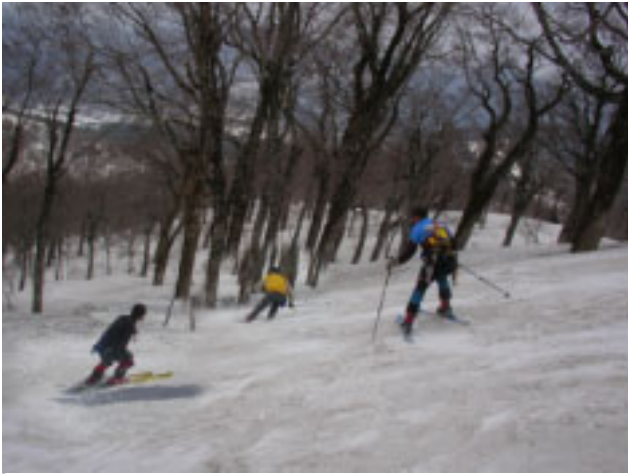
9:30 空身で3本南のブナ林へ