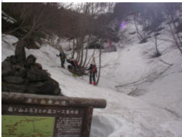
7:42 登山道から沢づたいに上がる