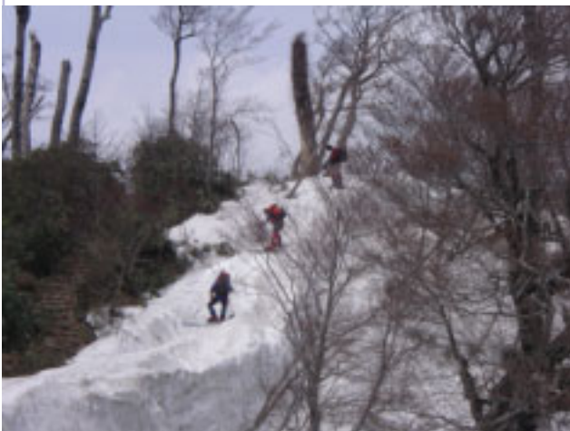
11:50 ややこしいカール上通過