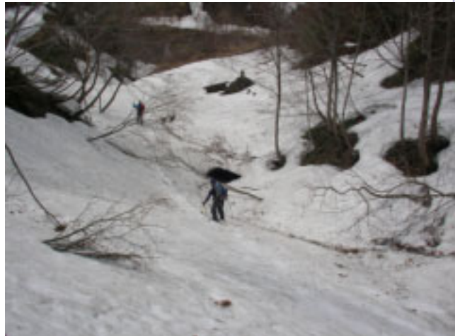
12:11 来たルートを滑降