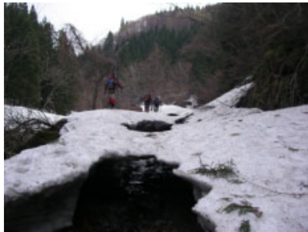
7:21 スノーブリッジを慎重に！