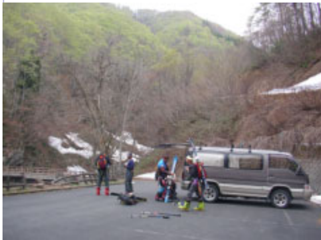
6:52 ふる里の森スタート