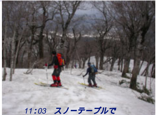
11:03 スノーテーブルで 昼食を済ませ下山開始