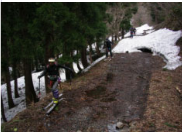
12:32 どこまで滑るねん?