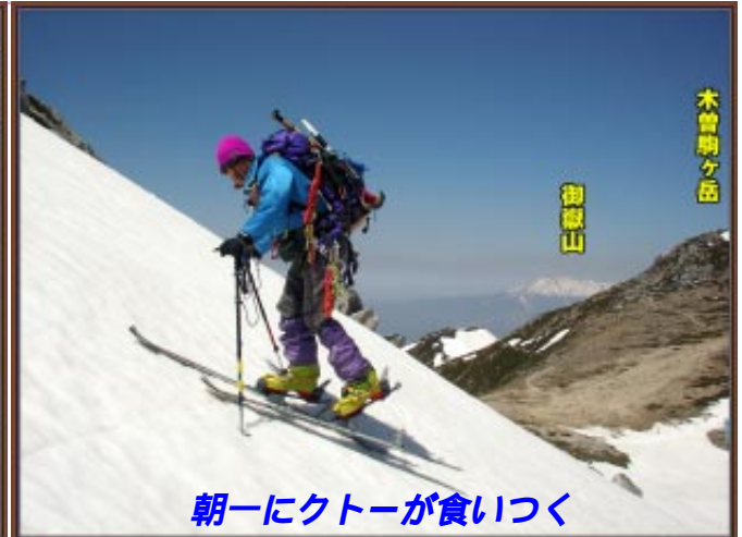
朝一にクトーが食いつく

ンティニアスで登攀していて二人共滑落死しているから厳しくなつたと言っていた。だから全てを「スカタット登攀してくれ」と言っている、こんな60度くらいの雪壁にスタカットしてはもたつくばかりなのに・・・とブツブツ言っていると先行パーティがモタモタとしてなかなか降りて来ない。心中では「何してんねん？、早よ降りんかい！」と思っけていても「すみません、ハアハアゼエゼエ」の声を聞くと、「大丈夫かいな」と思っけてしまう。30分ほど待ってやっと我々の番がきたので半年ぶりのClimbingを思いだしてさっさと登攀したが、監視員はずっと双眼鏡で見ている。下りはスタカットピレーもじゃまくさいので持参のスリングとD環を2ピッチ残置して8環ですたこらさっさと降りてきた。White Bird はこんなことは山では日常茶飯事なので登攀道具は筆数項目で全くもって問題しないのだが、他人から強制されるのは遺憾である。