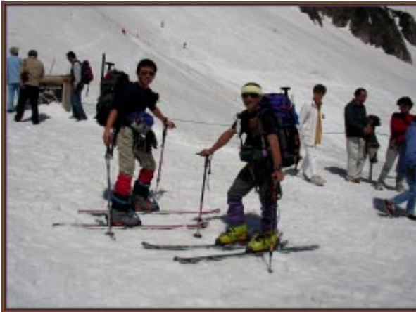
フル装備に身を固めて出陣

千畳敷----極楽平~~~三沢カール----極楽平/小宝剣ノド~~~千畳敷----千畳敷カール----宝剣岳スタカット climb---宝剣キャンプ