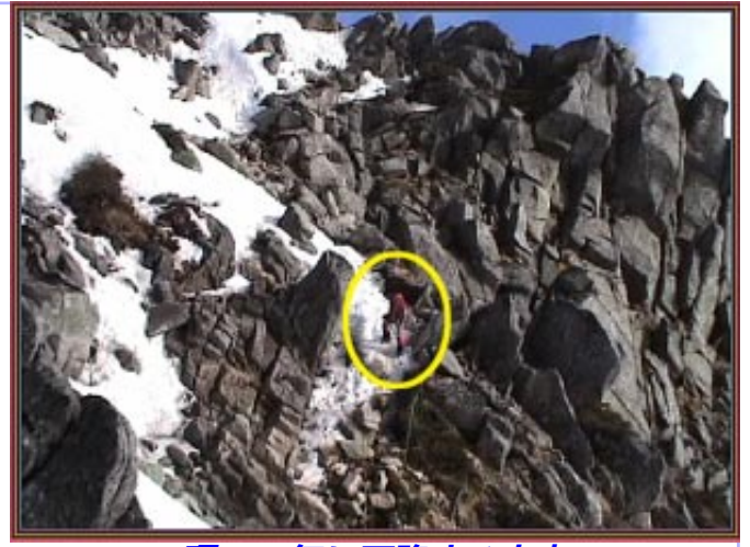
8環で一気に下降する大本

沢岳の素晴らしい斜面もダケカンバがうるさそうで、どうもよくない。よく見ると三沢稜線の2700m地点の斜面が下まで続いているように見えるので早速にトラバース体制に入って、雪尻直下から一気にドロップして行く。雪質もザラメで申し分なしで快適ターンを切ってアツという間に2500m地点の溜まりまで降りてしまう。そこから先もまだ滑れそうだが今回は常においしい箇所だけをつまみ食いなのでそそくさと登り返す。