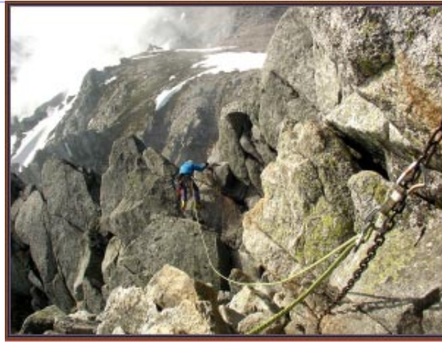
宝剣岳のスタカットピレー