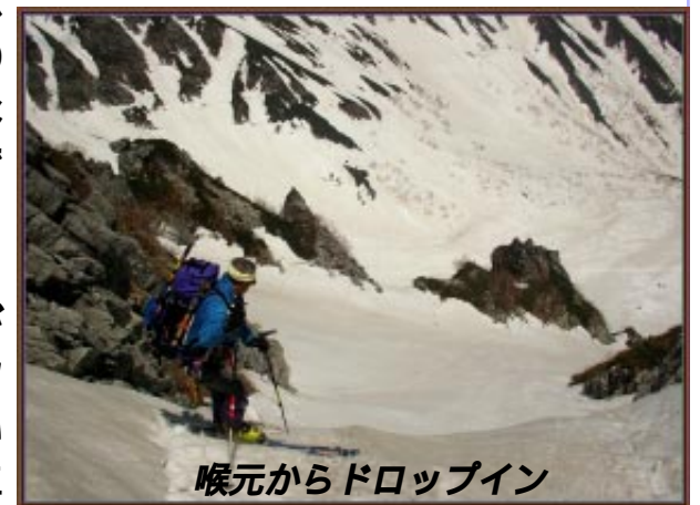
喉元からドロップイン