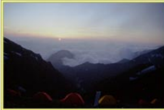
五龍キャンプ場の夕暮れ