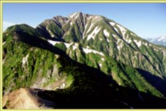
唐松手前より五龍岳