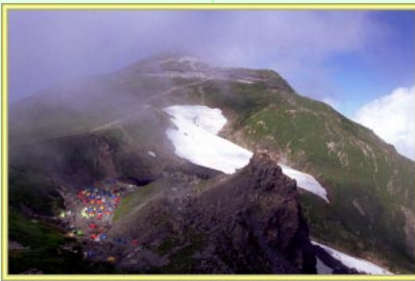
白馬キャンプ場と白馬岳