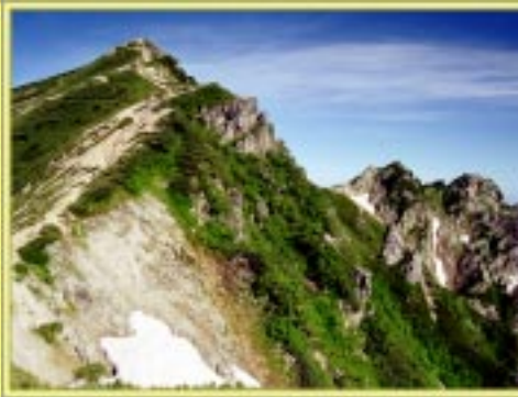
唐松岳と不帰キレット