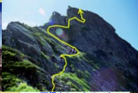
不帰キレットルート