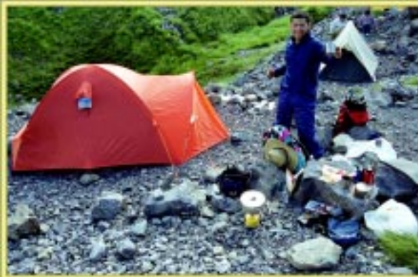
白馬キャンプサイト

ものすごい人が大雪渓から登ってきているのが確認出来る。また白馬山荘方面は人がごった返している。日本一でかい山荘でたとえ1500人収容可能でも今日は