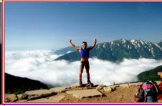
種池山荘より蓮華岳