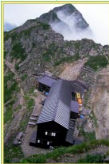
キレット小屋と五龍岳