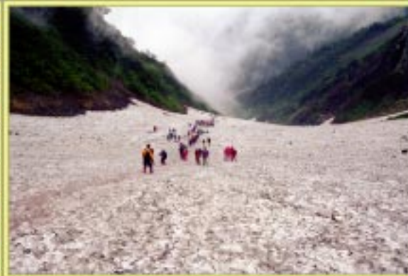
大雪渓を登る大集団

また昨日の五龍山荘と同じく一畳に3人は覚悟の上だろう。ホントにここが3000mの山の上かと思うくらいである。