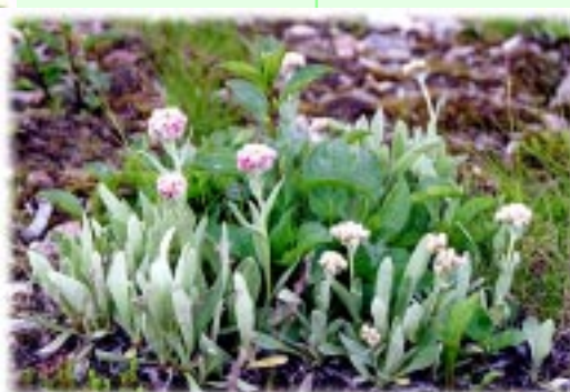
タカネヤハズハハコ