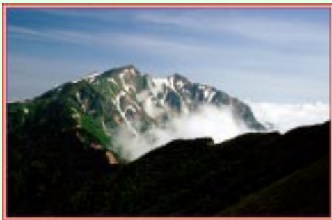
雲上の鹿島槍相似峰