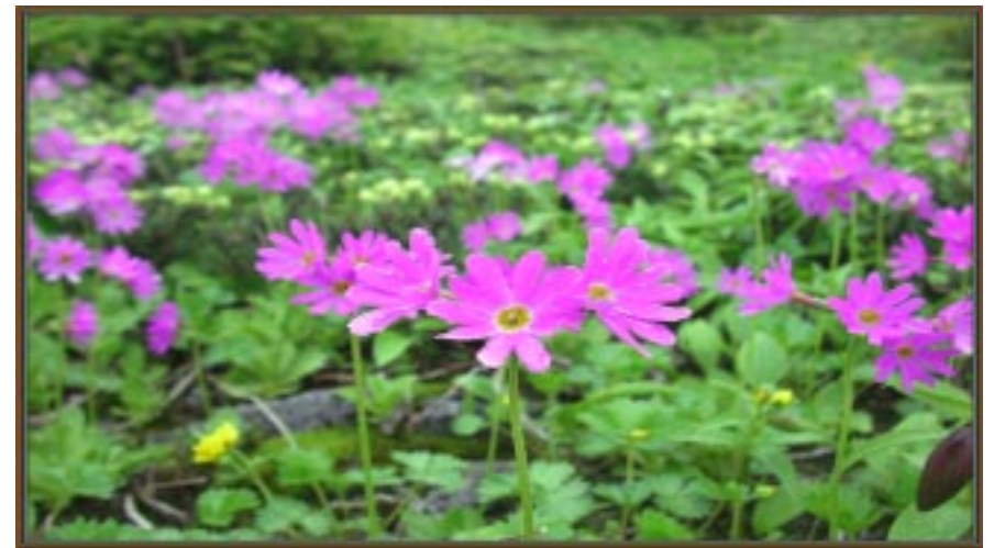
ハクサンコザクラの群生

そこで車2台を交通の足にと、1台を下山付近に止めておく計画にした。また今回は縦走未経験の可憐な女性二人が加わる。