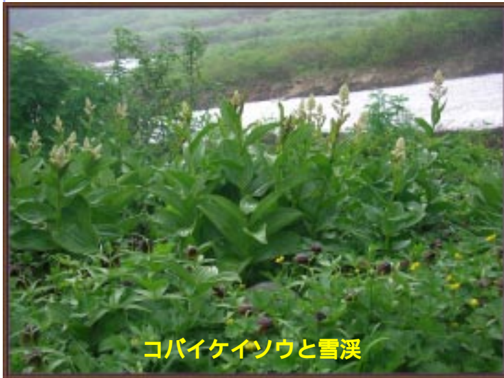
コバイケイソウと雪渓