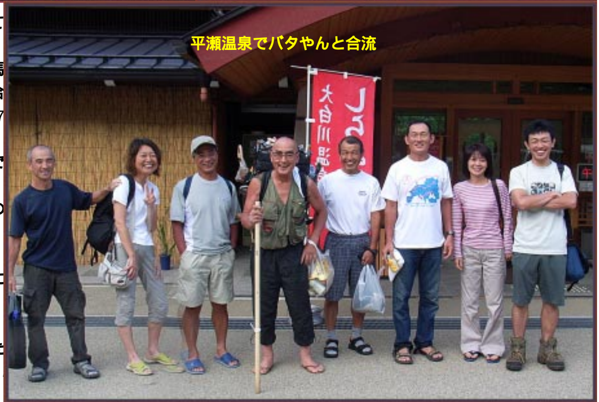
平瀬温泉でバタヤンと合流