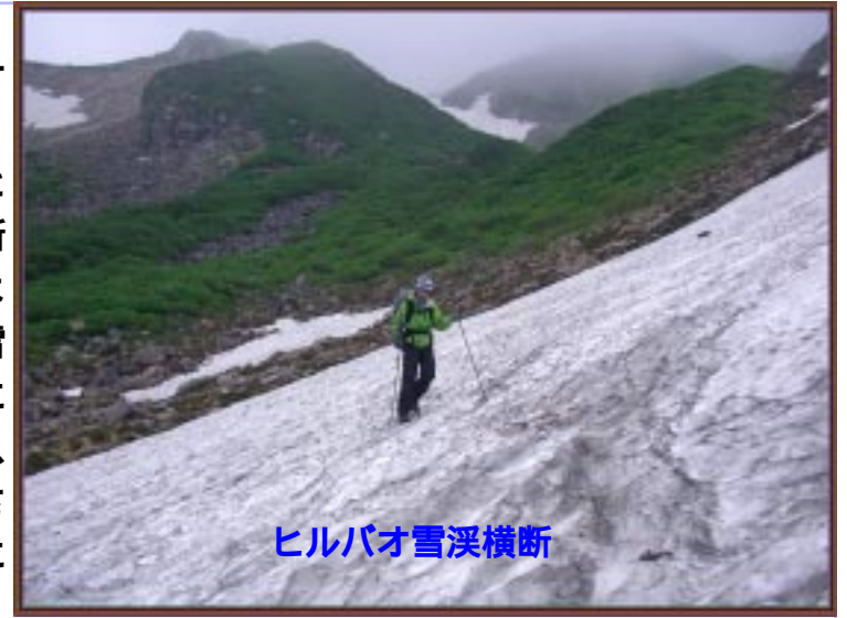
ヒルバオ雪渓横断

15:25 ヒルバオ雪渓横断 急坂を降りるとまずは雪渓横断である。昨年よりもとても残雪が多く風雨によって見事にスプーンカットされてカチカチに氷化している。