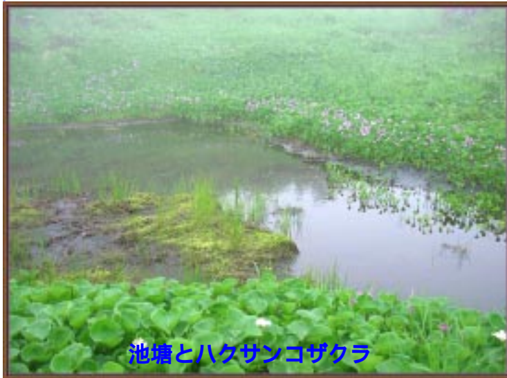
池塘とハクサンコザクラ

小ピークを越えて八エマツ帯を過ぎて行くと地塘のある北美陀ヶ原に辿り着く。ハクサンコザクラが地塘を囲み、その花