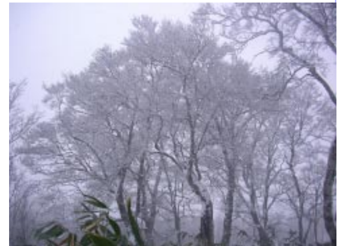
クリスタルブナ林