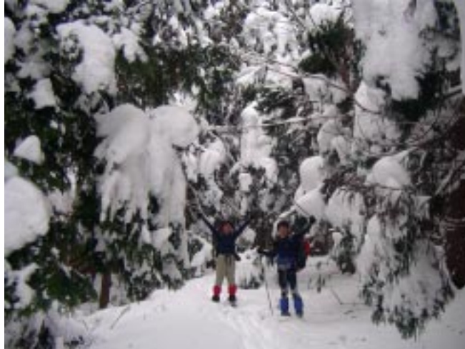
雪も多くなってきた