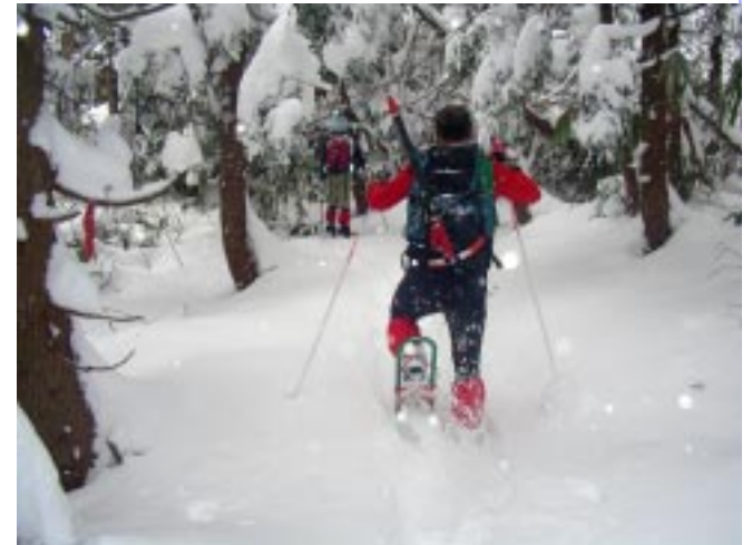
スノーシューに履き替えて