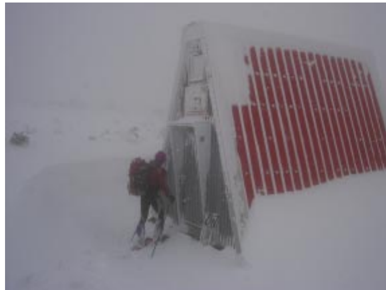
ようやく避難小屋へ

体も暖まってさぁ下山準備と、小屋の戸を開けると、な、な、何と吹雪は収まり青空が見えて太陽が顔を出してきているではないか！。180 度の展開に皆大歓声を上げて、早速に三ノ丸展望台までスノーシューを運ぶと・・・、そこから見える山頂付近のスノーワールドは今ここに来た者にしか味わえない素晴らしい世界が広がっている。この 10 年氷ノ山に通い続けているがこれほどに素晴らしい景色は見たことがない。風と雪と気温がうまくコラボレーションしなければ作り出せない光景である。