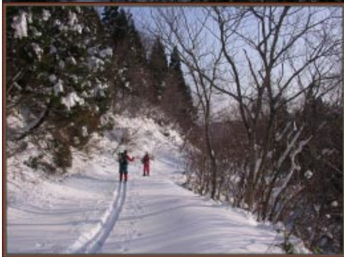
帰りはトレースを忠実に

シーズン始めに素晴らしい恵みもらった氷ノ山の山の神に感謝！、そしてよき仲間乾杯！