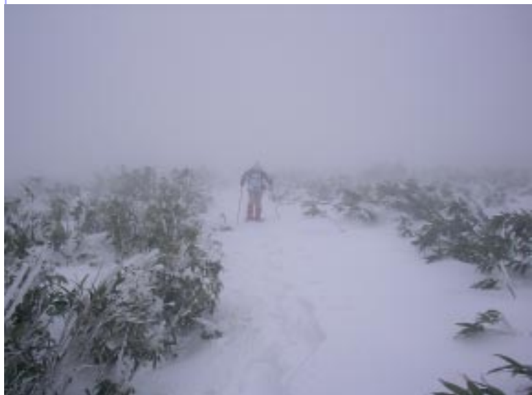
視界 50 m に

もう一降りか二降りもすれば氷ノ山特有のチシマ笹も雪に覆い尽くされて三ノ丸も雪原に化すことだろう。しかし目標物がなくなるので視界 50 m では完全にホワイトアウトになるので GPS とコンパスがなければ行動不可能になる。