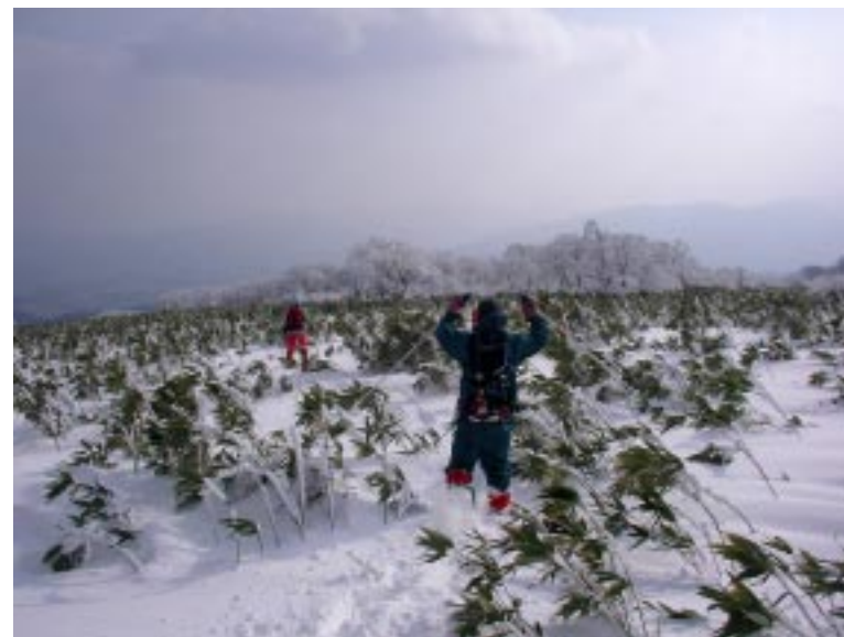
三ノ丸雪原はもうすぐだ