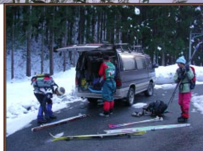
お疲れさんでした

シーズン始めに素晴らしい恵みもらった氷ノ山の山の神に感謝！、そしてよき仲間乾杯！