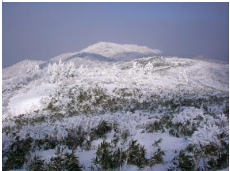
山頂付近はスノーワールド