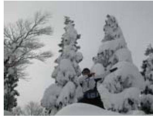
背後にモンスター

昼食を食べているとガスが晴れ、太陽の光が差してきた。樹氷を付けたブナ林と太陽の光がなんともいえない。ザックを小屋にデポして撮影会に興じる。