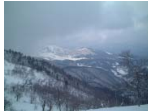
ガスが晴れ、スキー場が見える